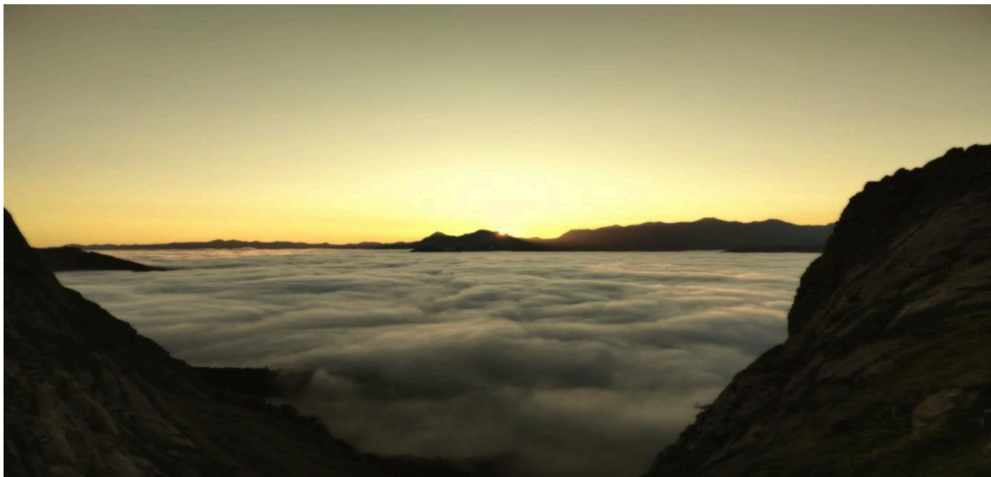
Mar de nubes subiendo Billare

Para esta salida de 2026 hemos preparado una visita a la impresionante zona francesa de Lescun. El lugar es idílico, con verdes prados, río y una bonita cascada que veremos en el comienzo de nuestra ascensión.